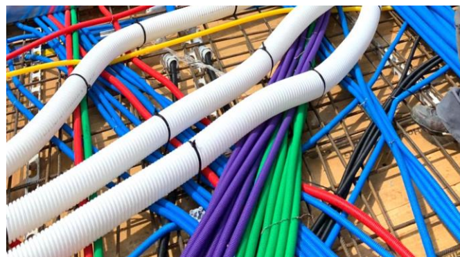
Bild: Rohre und Kabel am Laufmeter

Aktuell wird nun die Aussenfläche begrünt und die Gartenfläche hinter dem Müli Café erhält einen Sitzplatz mit Brunnen. Wir freuen uns auf die neuen Mieter und den Kontakt untereinander. Ganz besonders schätzen wir die Möglichkeit des direkten Zugangs zur Arzt- und Therapiepraxis. Dies wird für unsere Bewohnerinnen und Bewohner eine Erleichterung darstellen und sicher geschätzt werden.