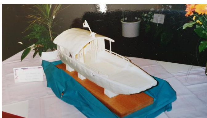
Auf dem Foto: Ueli- Fähre: kunstvoll gestaltet

Das leibliche Wohl hat in Pflegeheimen eine sehr hohe Priorität. Der Lebensradius ist im hohen Alter eingeschränkt, umso mehr schätzt man Abwechslung und Qualität in der Küche. Die Mülimatt-Küche wird seit über 10 Jahren von Christophe Sturm geleitet, der seine Kochtruppe mit viel Engagement und Wissen führt und täglich verschiedenste Leckerbissen auf die Teller zaubert.